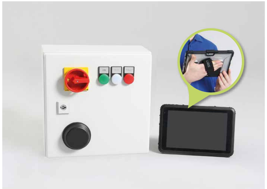
Schaltschrank mit Tablet | Control cabinet with tablet

control cabinet with integrated control, 10 m supply cable, on / off switch, control lamp, flow sensor, pressure sensor, impact resistant and waterproof CATERPILLAR (up to 1 m) T20 Tablet with Windows 10, incl. instruction manual