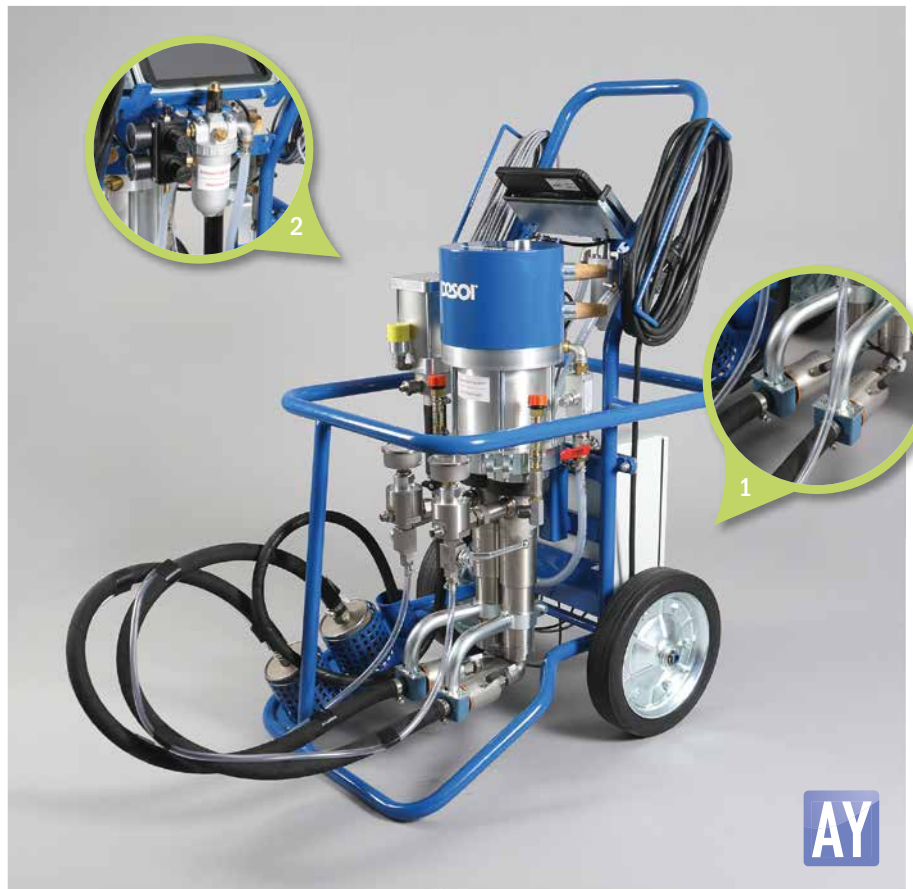
1. Durchflusssensoren | Flow sensors

The combination DESOL w.i.l.m.a. and DESOL AirPower M35-3C VA is ideal for injection work with acrylic gel. The piston pump achieves a delivery rate of max. 13 l/min at a mixing ratio of 1 : 1 and is equipped with a separate rinsing pump. The sealing sets inside are protected by an integrated spring pre-tensioned, manual re-tensioning is not necessary. DESOL w.i.l.m.a. monitors and documents the material consumption, the injection pressure and the mixing ratio.