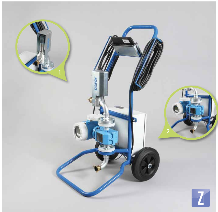
1. Drucksensor, Anschluss Materialschlauch | Pressure sensor, connection material hose 2. Durchflusssensor | Flow sensor