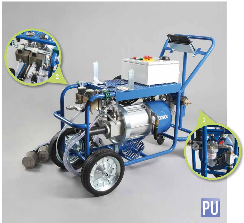
1. Druckminderer mit Manometer und Frostschutzeinrichtung | Pressure regulator with manometer and anti-freeze device 2. Durchflusssensoren | Flow sensors

For the processing of PU and silicate resins the combination DESOL w.i.l.m.a. with the piston pump DESOL AirPower L36-2C is the optimal solution. Due to the large dimensioned material passages, the piston pump is also suitable for highly viscous injection materials and achieves a delivery rate of max. 20l/min at a mixing ratio of 1 : 1. DESOL w.i.l.m.a. monitors and documents the material consumption, the injection pressure and the mixing ratio.